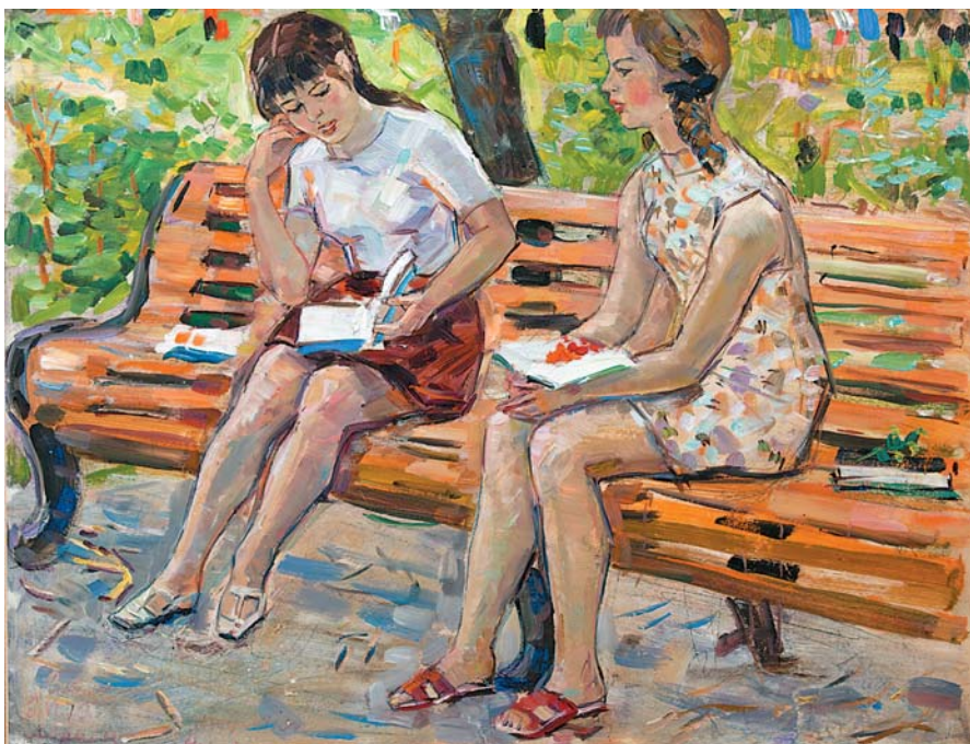
В.Н.Лосев. Студентки читают. 1970-е, к., м., 415x555