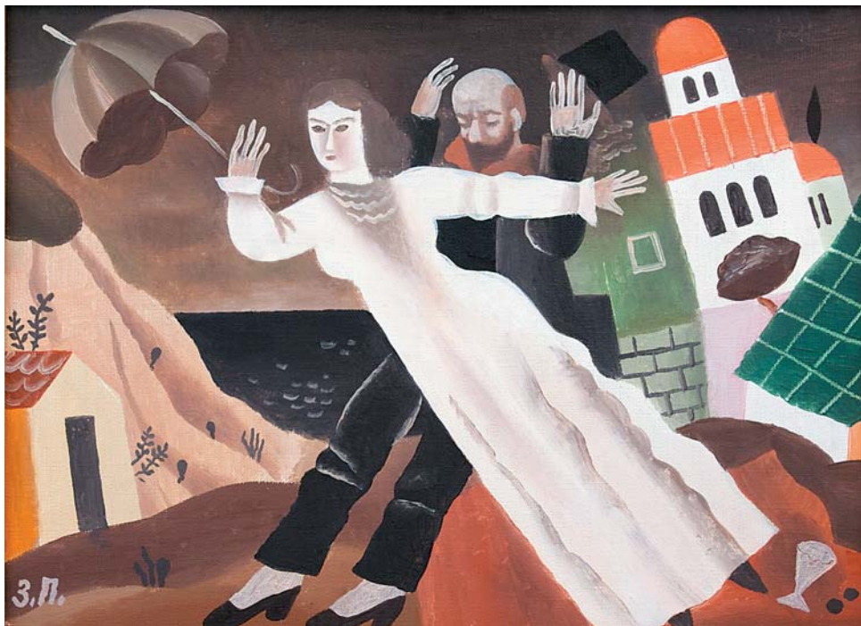
П.Е.Зверховский. Смерч на берегу моря . 1995, х., м., 285х385