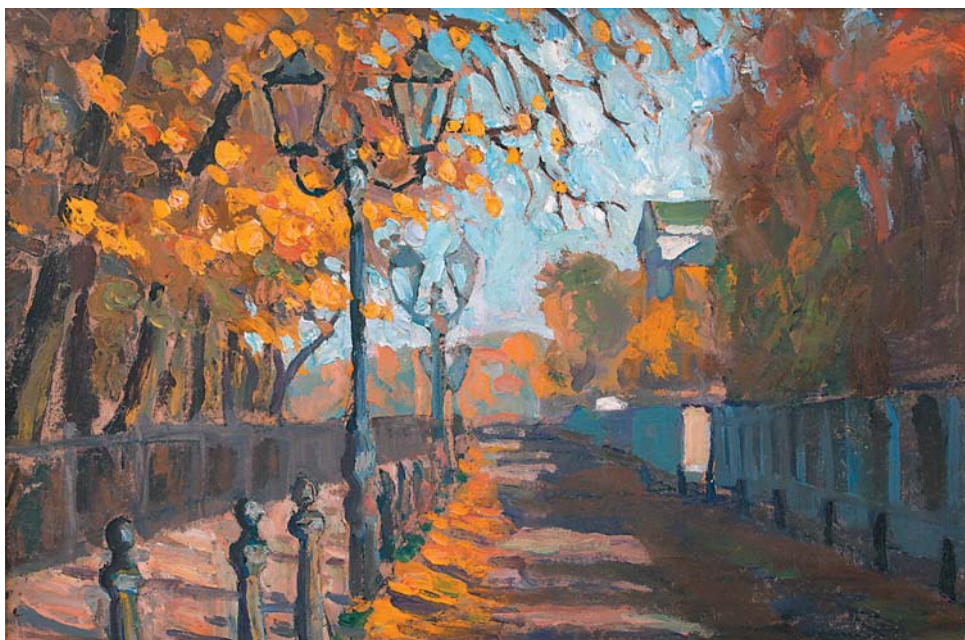
Н.Н.Медовицков. В парке. 1941, х., м., 450x670