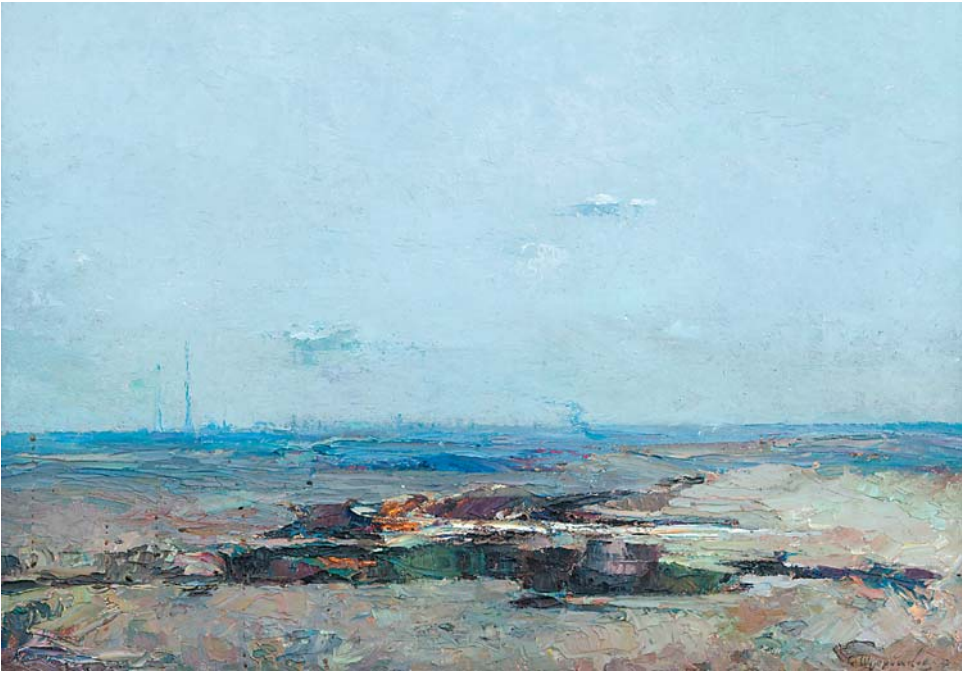
С.А.Щербаков. В степи. 1993 г., м., 480х670