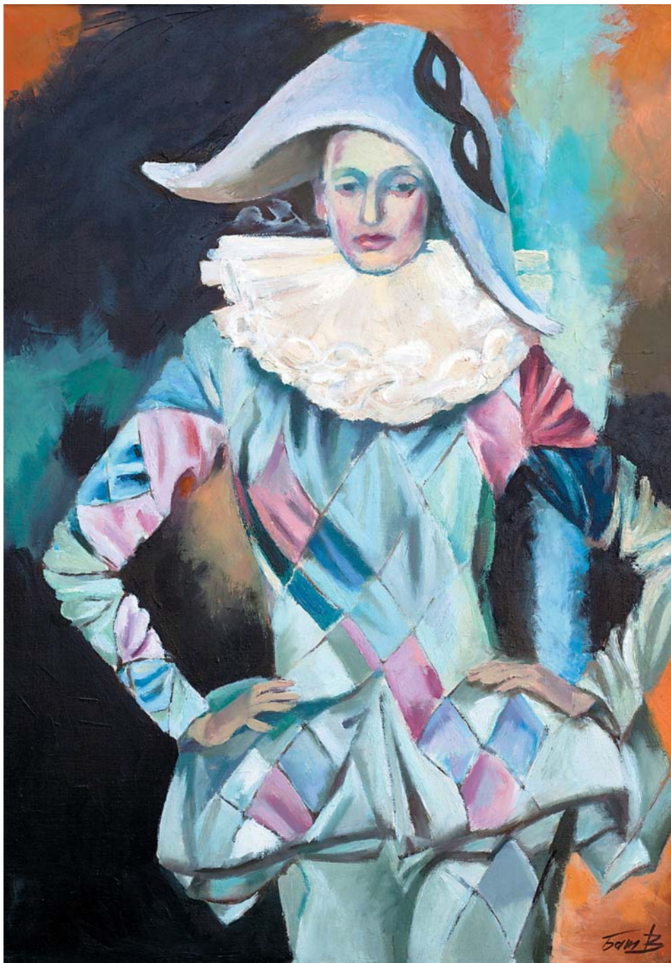
В.Н.Батраков. Начало . 2008 г., м., 680x495