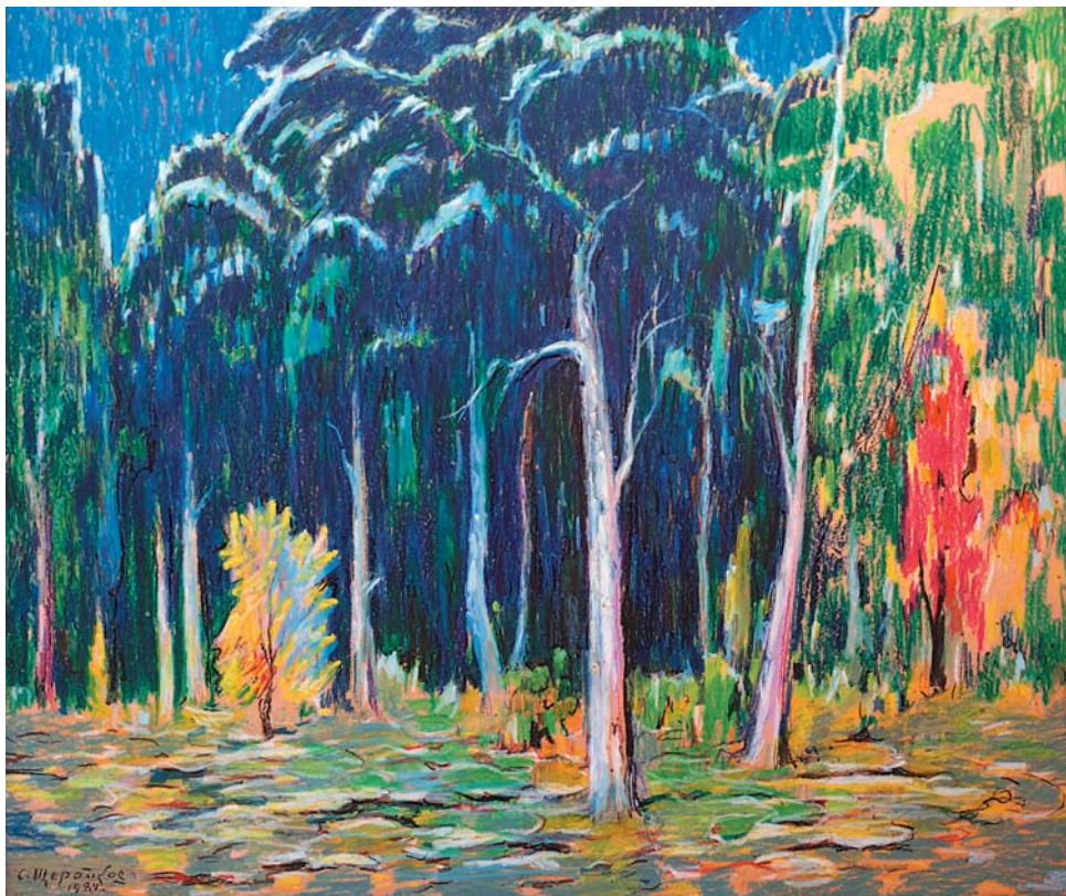
С.А.Шербаков. Лесная чаща . 1984 к., м. п., 700x830