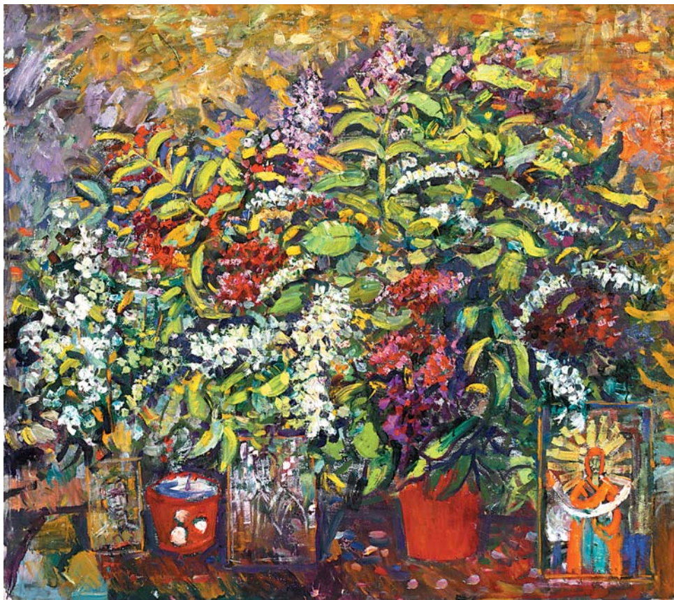
В.Н.Лосев. Цветы Победы. Нач. 1970-х, х., м., 1170х1340

творческого высказывания позволяет преодолеть прямолинейность и ограниченность официального толкования патриотизма. Камерному искусству, представляющему собой диалог художника и природы, отражающему в первую очередь бытие сознания, свойственен интимный, домашний характер работ. Его отличают эмоциональность и антиописательность, дистанцирование от социальной проблематики и тонкость нюансов, внимание к деталям и изменчивым состояниям. Камерное искусство реабилитирует ценность сложного сокровенного мира души, невостребованного как полвека назад, так и сегодня. Это “живопись, живущая в зазоре между невероятным и очевидным”.