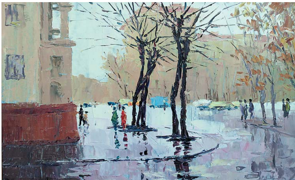
Б.А.Чепкасов. Дождливый день. 2000, к., м., 195x265