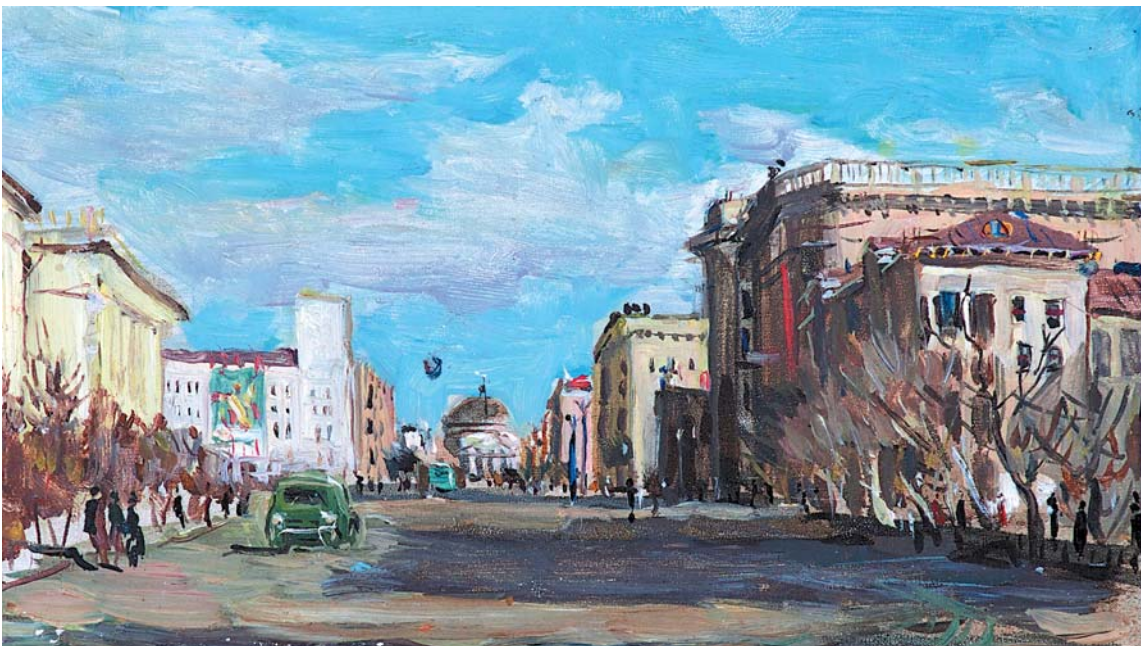
В.Н.Лосев. Улица Мира. 1950-е, к., м., 95x170