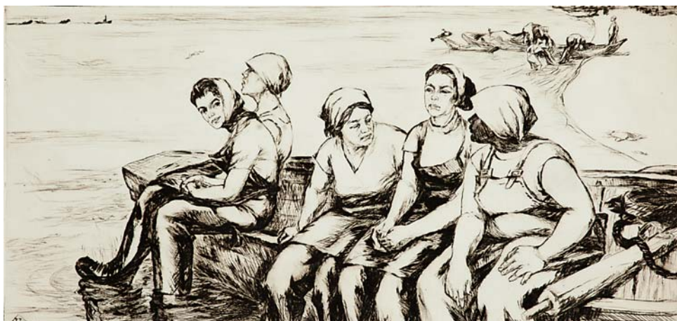
А.П.Легенченко. Рыбачки. 1970, б., офорт, 300x620