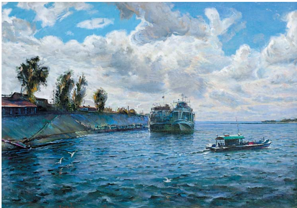
П.Б.Аразов. Левый берег. Ветрено. 2007, х., м., 660x960