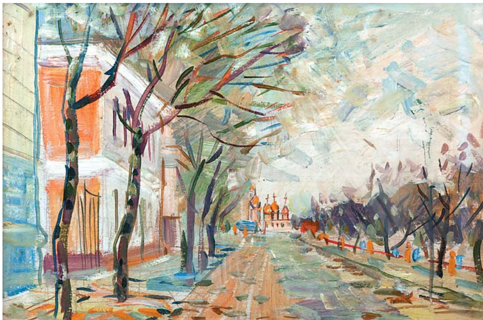
В.Н.Лосев. Дорога к храму. 1970-е, к., м., 330x495