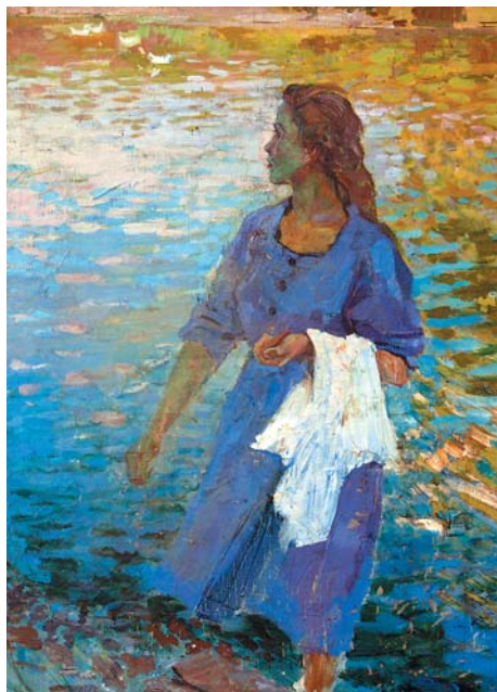
Г.М.Котов. У берега. 1960, х., м., 780x580