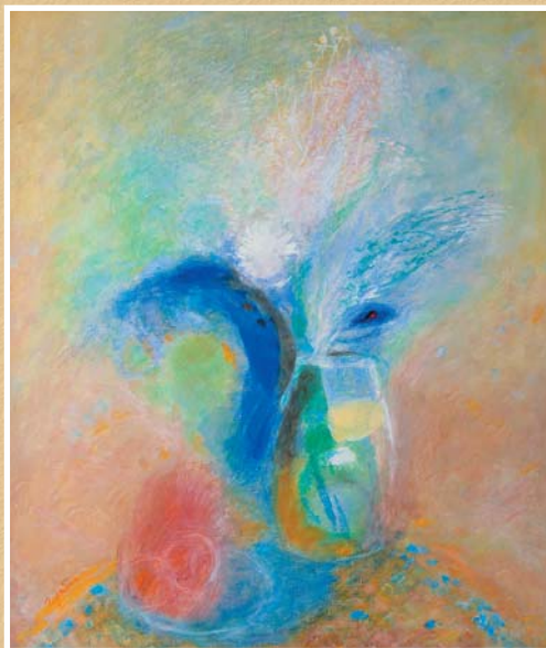
А.Е.Горябин. Натюрморт. 1997, х., м., 590х700