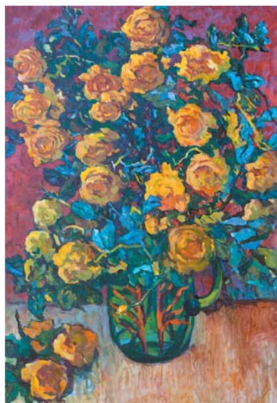
Б.Г.Осиков. Букет . 1980-е, х., м. 1430х940