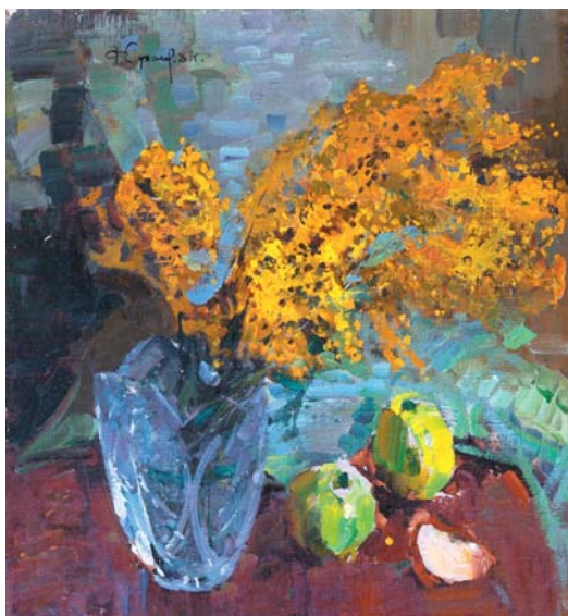
Ф.И.Суханов. Мимоза . 1987, х. на к., м., 540х490