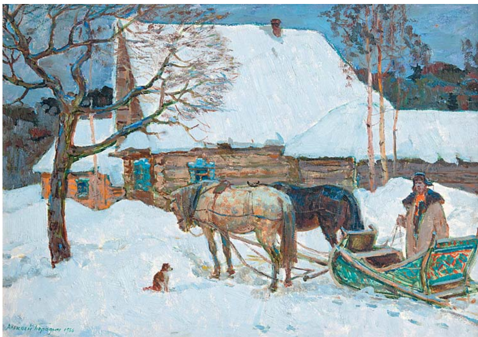
А.И.Бородин. В Бубновке. 1965, х., м., 480x680