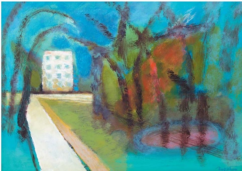
А.Е.Горябин. Солнечный день. 2007, х., м., 450х640