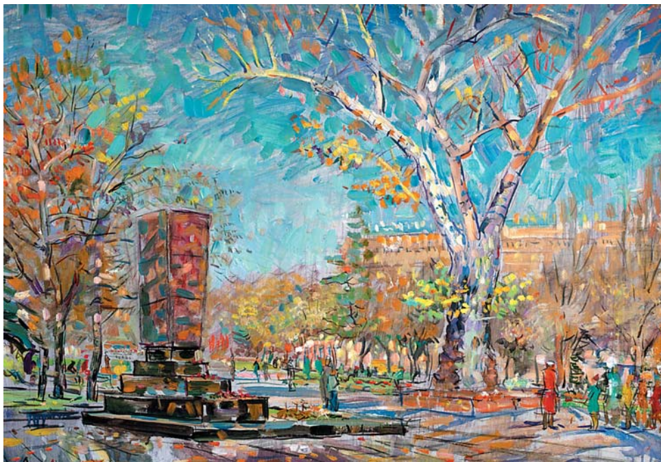
В.Н.Лосев. Волгоград. 1989, к., м., 630x880