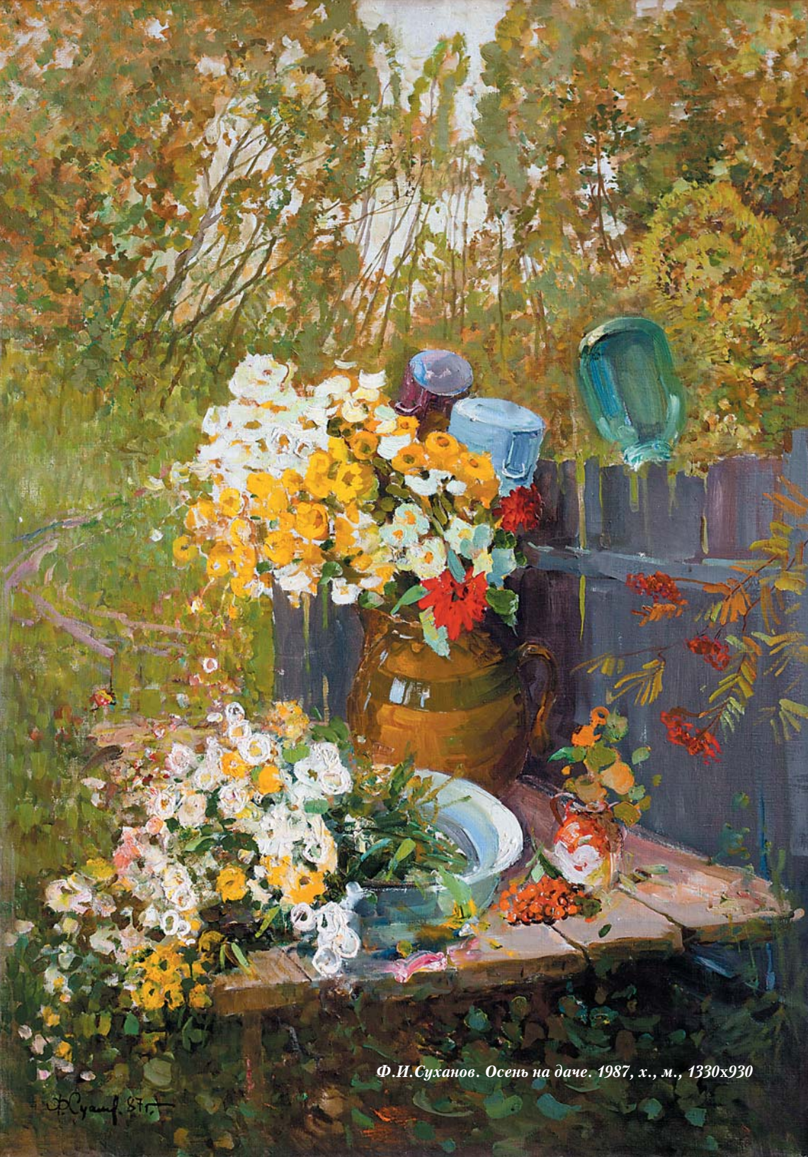
Ф. И. Суханов. Осень на даче. 1987, х., м., 1330x930