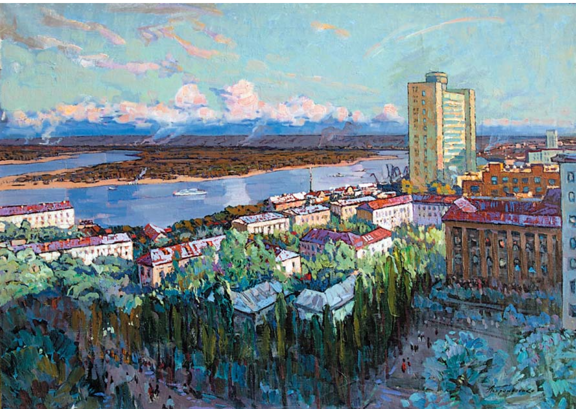
А.А.Прокopenko. Гроза прошла . 1968, х., м., 960х1350

Выставка “Город, в котором тепло” дает возможность осознать искусство нашего города как значительное и самобытное явление, вписанное в канву общекультурных событий, но, безусловно, обладающее собственным лицом. И испытать гордость и, может быть, ностальгию. Она дарит особый взгляд на нашу историю, возможность встретиться с несколькими поколениями ярких и очень разных художников Сталинграда–Волгограда – от довоенного периода до наших дней.