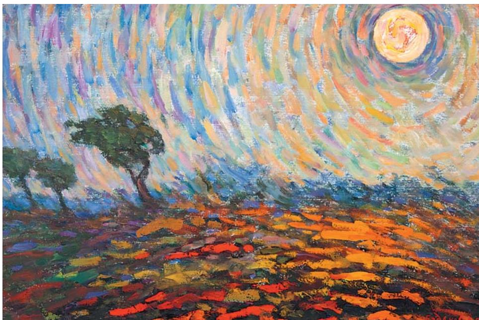
А.П.Ездаков. Солнечный ветер. 2003, к., м., 320х470