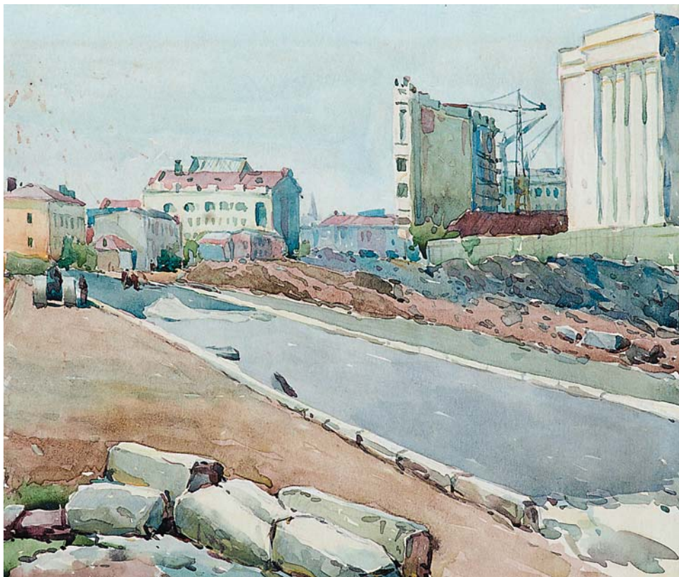
Б.Г.Осиков. Город строится. 1962, б., акв., 165х195

дальнейшее развитие. В собрании прекрасно представлены художники следующих поколений (С.Урмаев, А.Прокопенко, В.Тихонов, В.Коваленко, В.Батраков, В.Пугачев, А.Горябин).