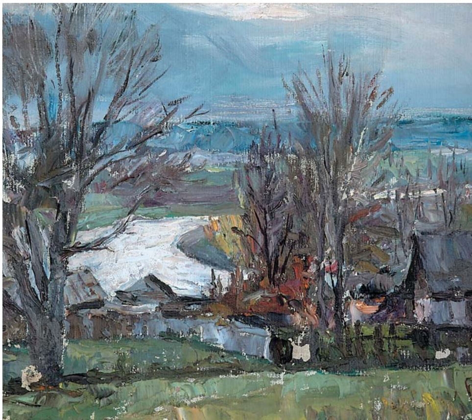
В.Я.Ягубкин. Звеногород. 1950-е, х., м., 250x275