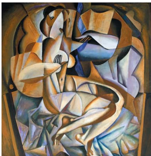
В.В.Тихонов. Отражение . 1991 г., м., 665x675