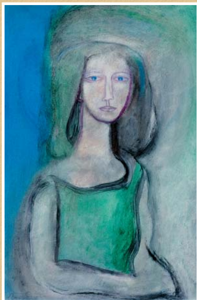
А.Е.Горябин. Анна. 2009, х., м., 900х595