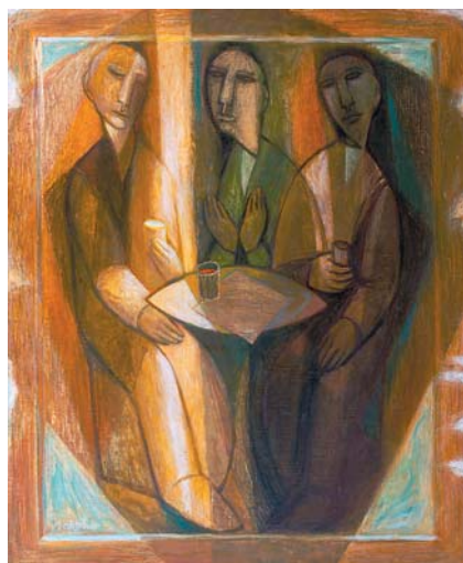
А.Е.Горябин. Душевный разговор . 1993 г., м., 690x575