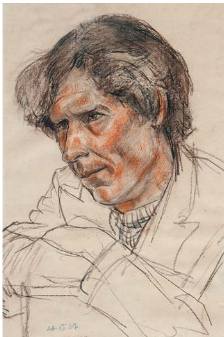
С.М.Зиман. Портрет Лосева. 1967, б., уг., кар, сангина, 500х330