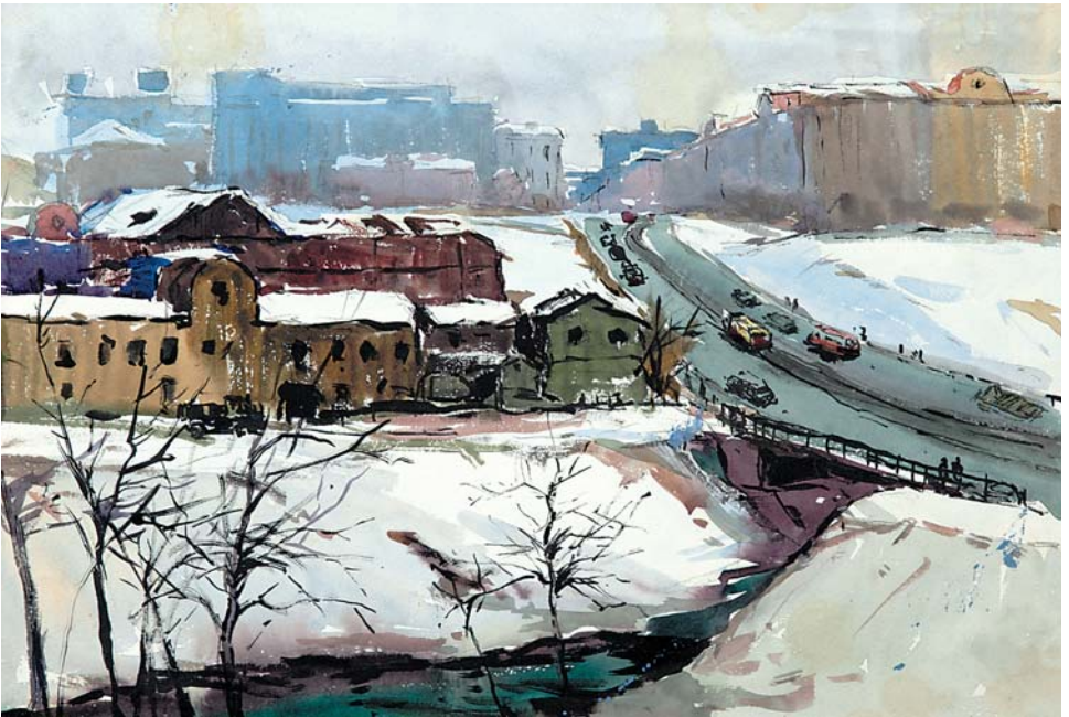
Б.Г.Осиков. Астраханский мост. 1960-е, б., акв., 260х380