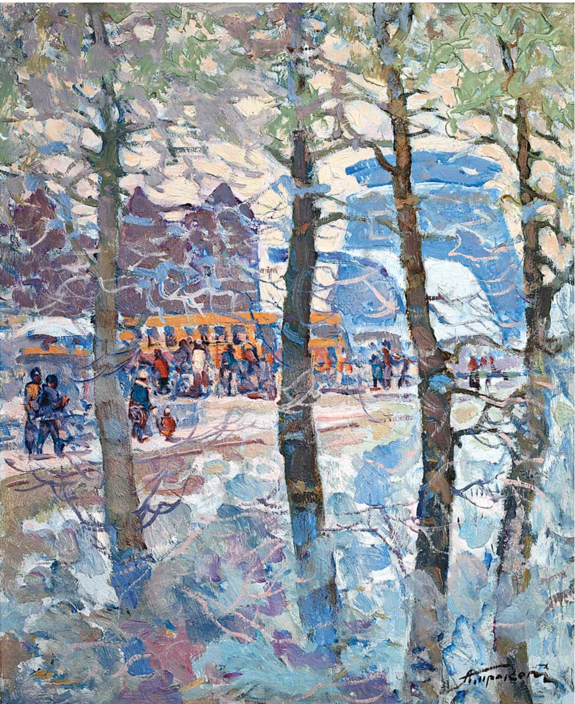
А.А.Прокопенко. Зимой у панорамы . 1974, х., м., 600х480