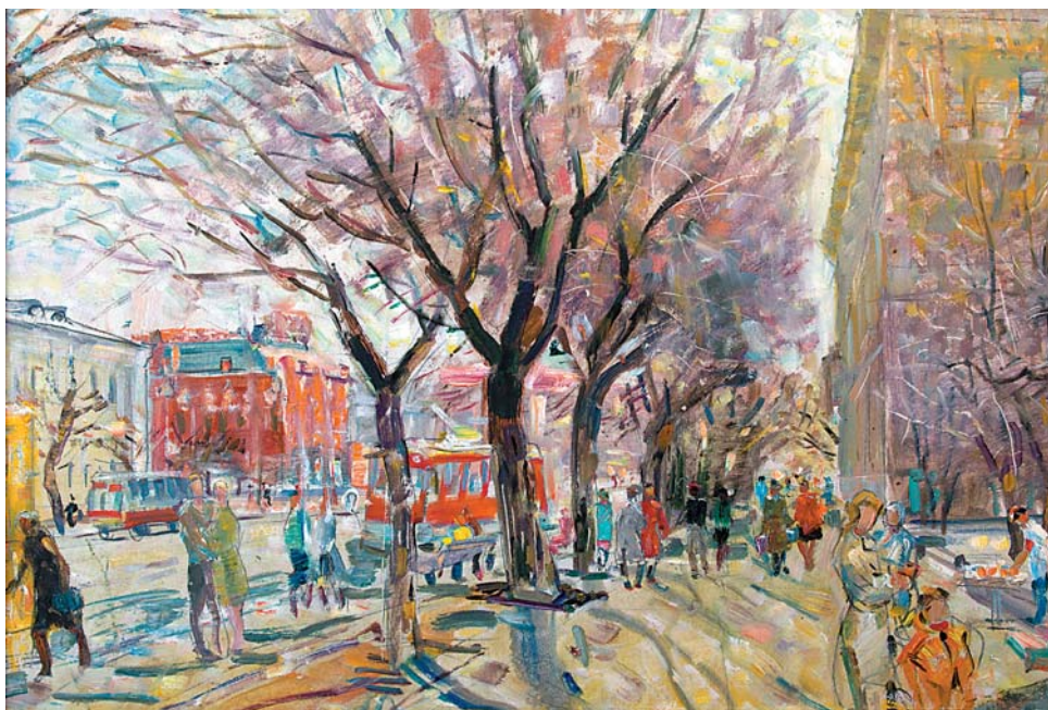
В.Н.Лосев. Остановка троллейбуса. 1980-е, к., м., 530x780