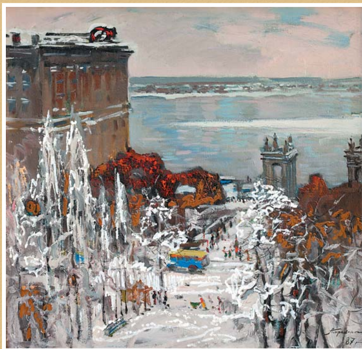
А.А.Прокopenко. Аллея героев. 1987, х., м., 490х640

На обложке: В.Н.Лосев. Ул. Мира. 1970-е, к., м., 655х465